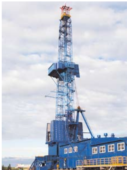
Буровая установка «Екатерина»

Кроме того, в 2008 году на Бованенковское месторождение доставлены первые три буровые установки из девяти, проводится подготовка к началу бурения в текущем году эксплуатационных скважин. Первая буровая установка, которая начнет бурение скважин на месторождении, произведена на одном из ведущих российских машиностроительных предприятий – «УРАЛМАШ – Буровое оборудование» и получила имя «Екатерина». Это буровая установка пятого поколения, которая воплотила в себе лучшие и самые прогрессивные отечественные конструкторские идеи.