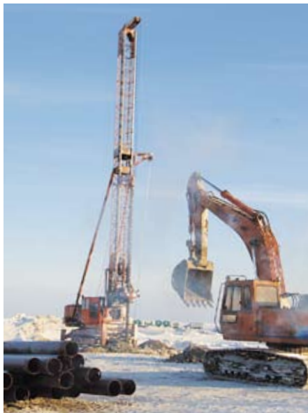
Обустройство Бованенковского месторождения идет полным ходом

газа по новым газопроводам составит более 2500 километров.